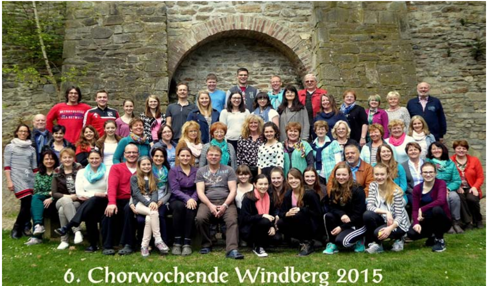
6. Chorwoche Windberg 2015